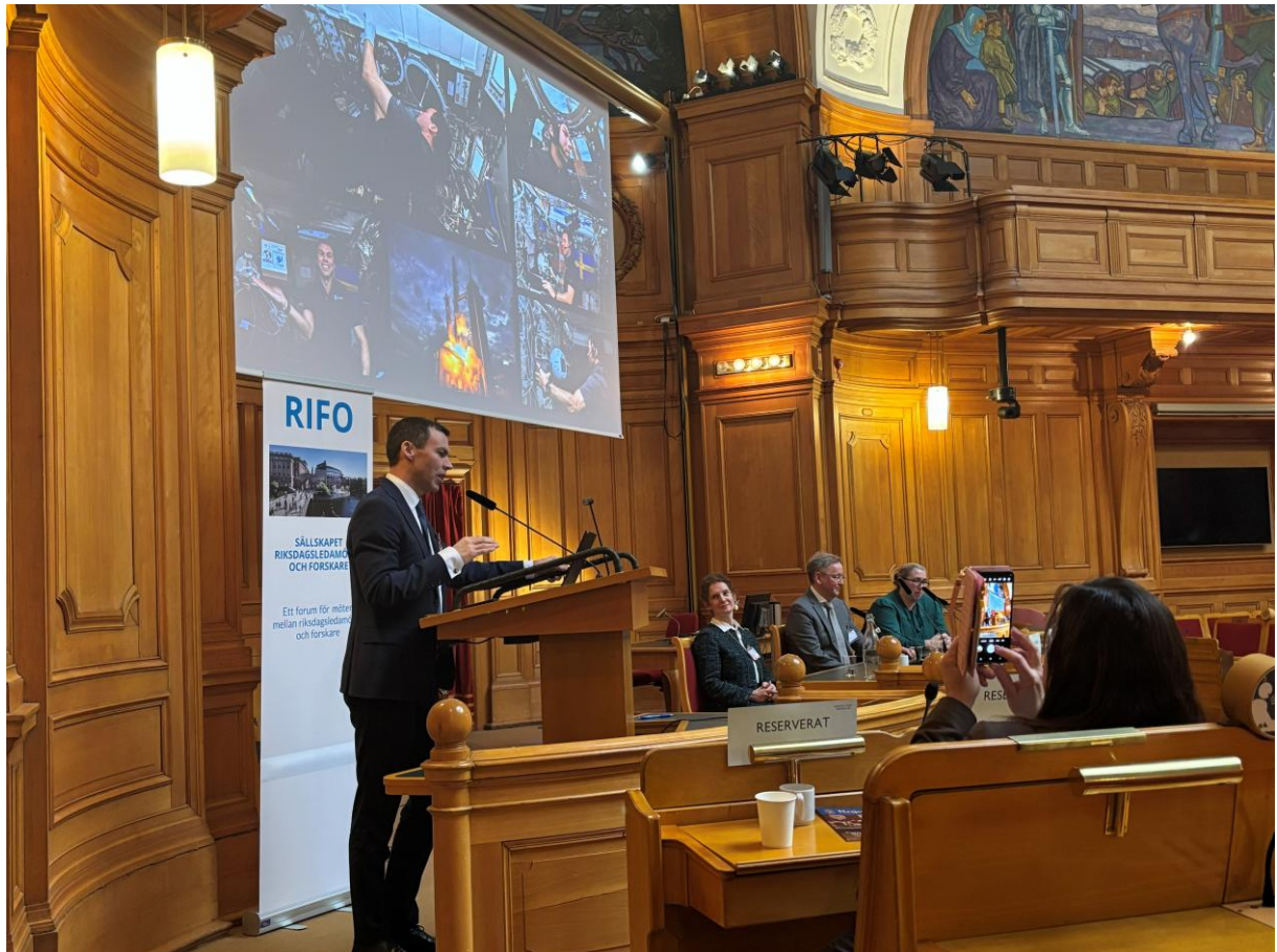
Marcus Wandt håller ett anförande i samband med ett seminarium om rymdforskning den 13 februari.

12 mars: Återträff nätverksprogram Rifo – Sveriges unga akademi 2024/25. De åtta forskarna i programmet besökte talmannen och EU-nämnden varefter de deltagande paren träffades för en avslutande lunch.