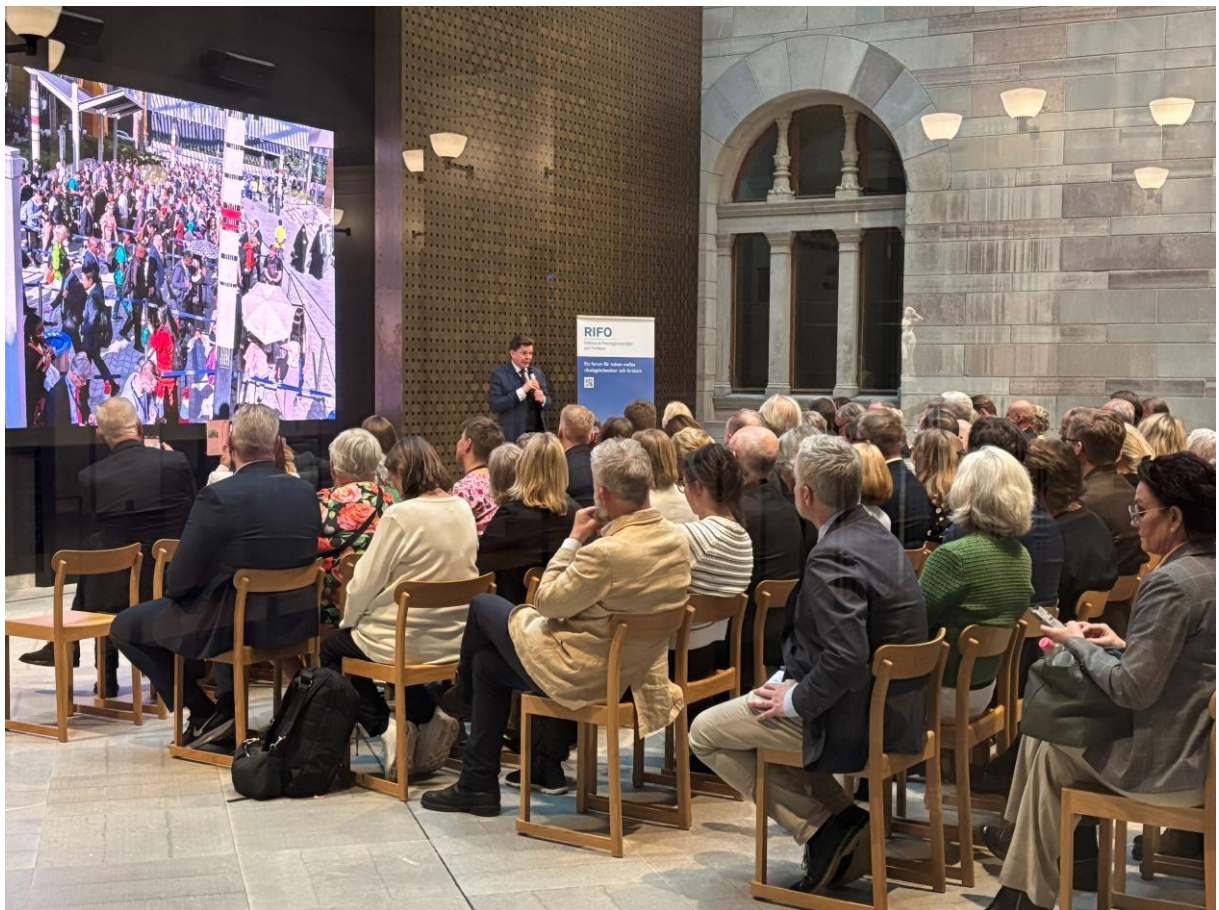
Talman Andreas Norlén vid Rifos mottagning tillsammans med Riksbankens Jubileumsfond den 21 maj.