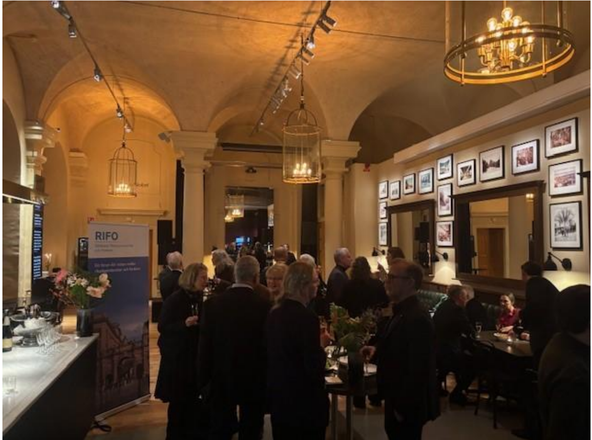
Studiebesök för Rifos medlemmar på Nobelprismuseet den 12 november.