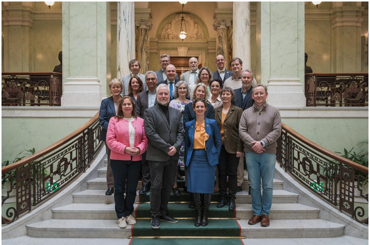
Delar av Rifos styrelse i samband med ett styrelsemöte den 7 maj.