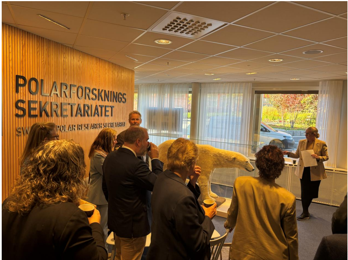
Rifos styrelse besöker Polarforskningssekretariatet under en studieresa i Luleå den 29 september.