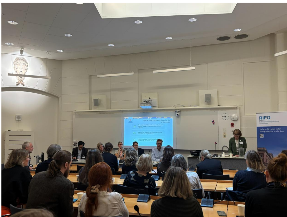
Seminarium som socialt hållbar bostadsförsörjning tillsammans med Formas den 14 maj.

Antal deltagare: 63 varav 20 riksdagsledamöter.