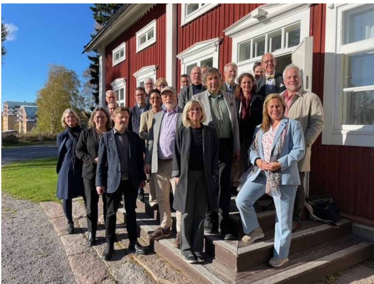
Rifos styrelse träffar forskare vid Luleå tekniska universitet under en studieresa den 29 september.